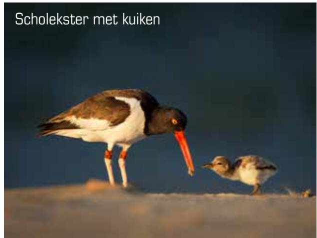
Scholekster met kuiken

sen georganiseerd. Verder zullen er gastlessen worden gegeven op scholen en toolboxmeetings op loonbedrijven. Onze registratieapp is tegen een redelijke vergoeding beschikbaar om in te zetten als leerhulpmiddel. Verzoeken tot informatie van scholieren zullen we over het algemeen honoreren, stagiaires van het HBO zijn van tijd tot tijd welkom.