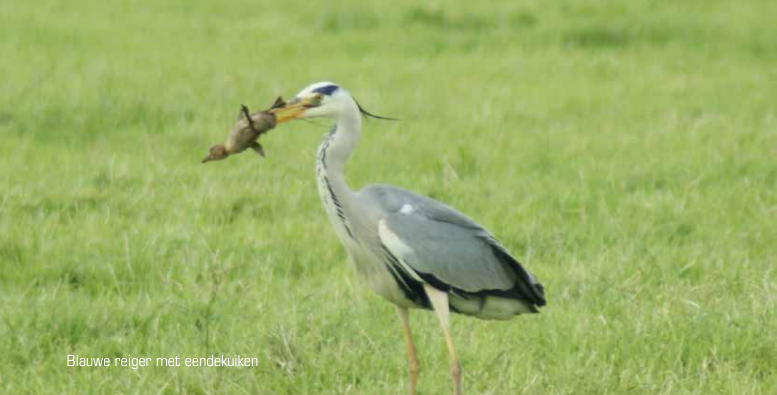
Blauwe reiger met eendekuiken