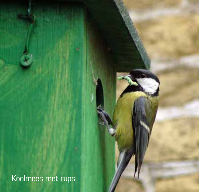
Koolmees met rups

de oppervlakte, bijvoorbeeld minder rendabele percelen, te benutten voor de aanleg van (griepel)plasdrassen omringt met kruidenrijke percelen. Een plus kan hierin bereikt worden als boeren aangrenzende gronden op gelijke wijze beheren, waardoor grotere aaneengesloten weidevogelgebieden ontstaan. Boeren die nu al meewerken in het ANLb-systeem (agrarisch natuur- en landschapsbeheer) kunnen hun inspanningen voor dit beheer onderbrengen in het weidevogelplan. Een dergelijk plan kan dienen als invulling van de verandering, transitie, die in de landbouw is ingezet. We zien dat het Maatschappelijk Verantwoord Boeren dat wij al vele jaren bepleiten, nu zijn plaats begint te krijgen onder namen als NatuurInclusieve Landbouw en Kringlooplandbouw. Wij zullen onze contacten met boerenorganisaties en grondeigenaren blijven aanspreken om deze transitie in grondbeheer en -gebruik te stimuleren en te promoten.