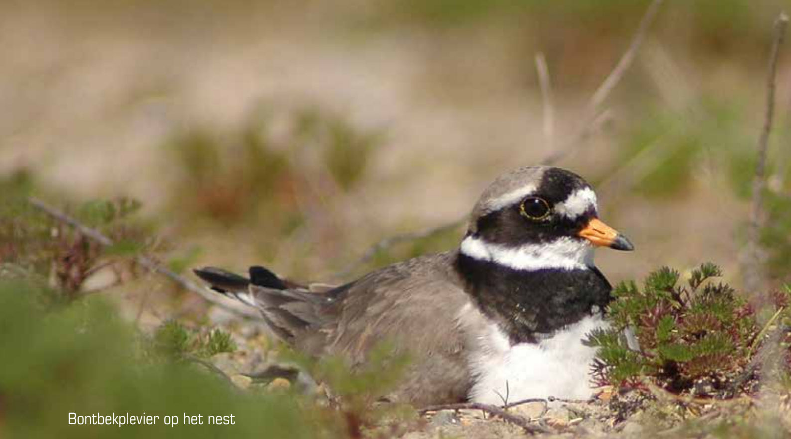
Bontbekplevier op het nest