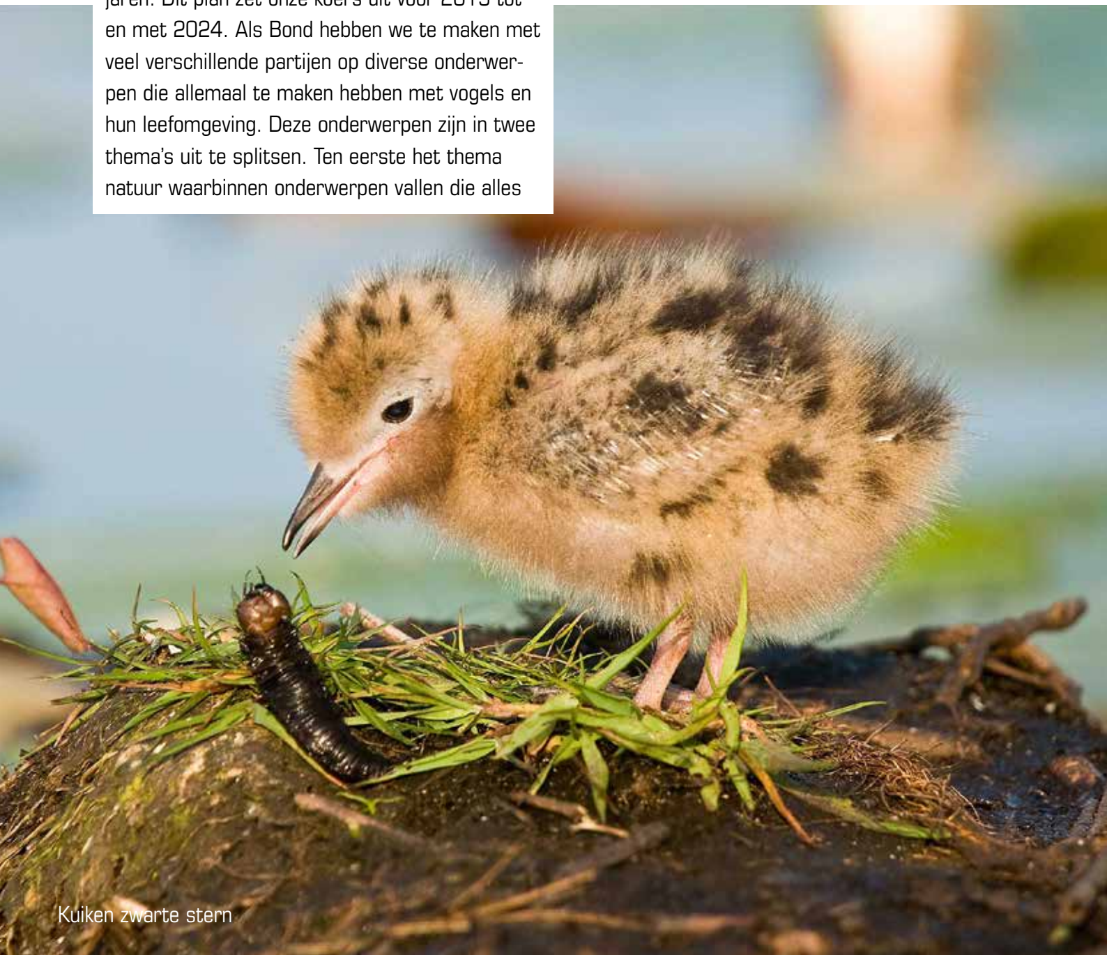
Kuiken zwarte stern

te maken hebben met de ons omringende natuur en de vogels die daarin leven. Het tweede thema is onze organisatie waarin onderwerpen een plaats vinden die gaan over de organisatie van onze Bond en de verbinding en ondersteuning van de 110 bij ons aangesloten lokale vogelwachten. In dit plan gaan we eerst in op het ontstaan van de BFVW en wat onze centrale opdracht is. Vervolgens behandelen we de beide thema's die we uitsplitsen naar de diverse onderwerpen.