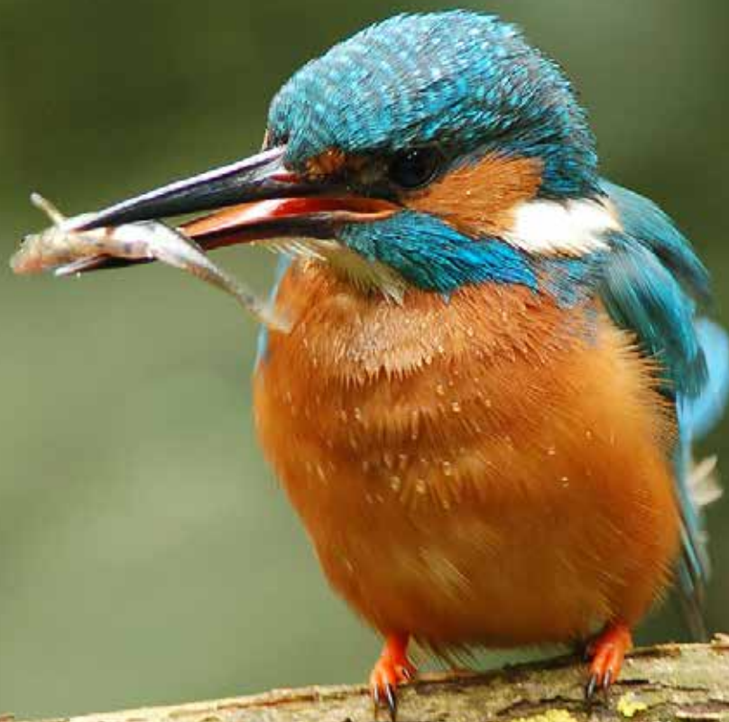
Ijsvogel met visje