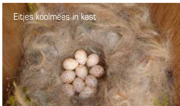
Eitjes koolmees in kast

We streven naar een hoge kwaliteit van gegevenslevering, zodat onze data geschikt zijn voor gebruik ten behoeve van agrarisch natuurbeheer en voor onderzoek over onderwerpen als populatieomvang, effectiviteit van beheertypen en predatie.