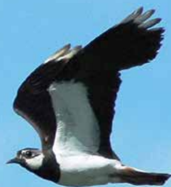
Kievit in vlucht

De BFVW beschermt de vogels en hun leefgebied in Fryslân, we benutten kansen om de teruggang van de (weide)vogels te keren. De BFVW pakt de belangrijkste bedreigingen voor de (weide)vogels, zoals verlies van biotoop en toenemende predatie, in Fryslân aan. De BFVW maakt de Fryske samenleving bewust van het feit dat ook zij actief kan bijdragen aan de bescherming van vogels. De BFVW is het kenniscentrum voor monitoringsgegevens en beschermingsmaatregelen voor vogels in Fryslân